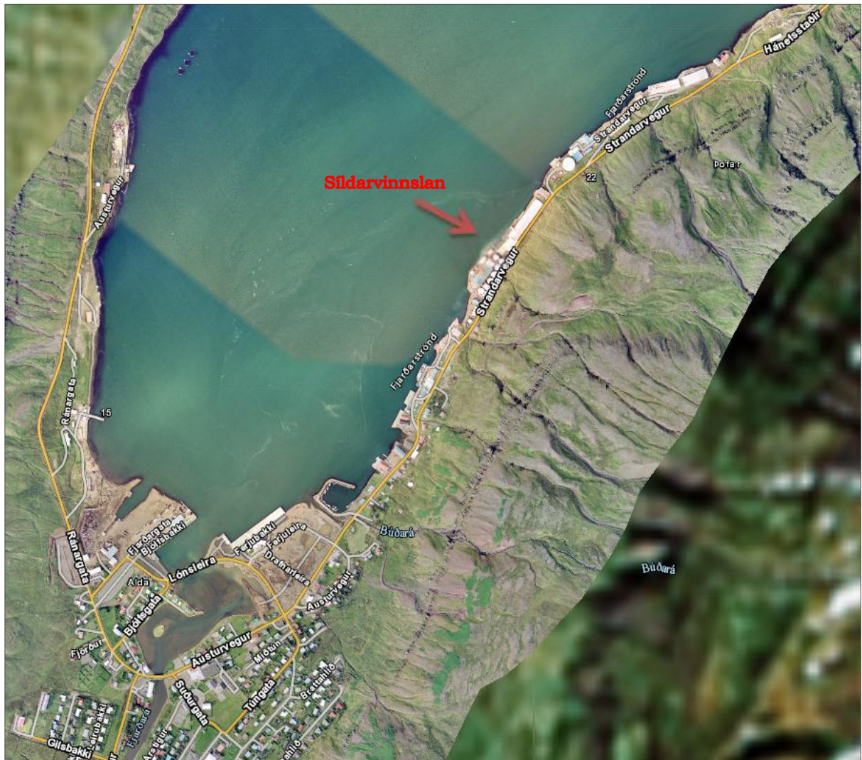
Mynd 2 Loftmynd af Seyðisfirði. Fiskimjölsverksmiðja Sildarvinnslunnar er merkt inn á myndina.