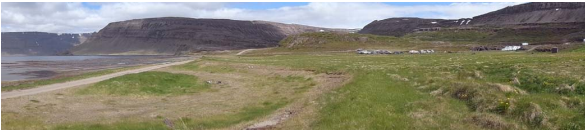
Mynd 4.2 – Strandsvæðið neðan við tjaldsvæði, fyrirhuguð aðstaða fyrir húsbíla.

Fossinn Dynjandi sem er í Dynjandisá, á upptök sín á Dynjandisheiði í Eyjavatni og rennur áin til sjávar í Dynjandisvog. Sérstaða Dynjanda er hversu formfagur fossinn er þar sem hann steypist sem brúðarslör fram af 100m hárrí fjallsbrún eftir hörðu blágrýtislagi. Dynjandisfoss er um 30m breiður efst og 60m neðst. Svæðið beggja vegna árinna er allvel gróið og vaxið birkikjarri norðan hennar. Sunnan árinna gætir gamallar búsetu, flatlendi neðst sem að mestu leyti eru gömul tún er tengdust bænum Dynjanda. Ofar taka við lyngivaxnar brekkur innanum klappir og grjót í bland við fjalldrapa. Í stöku votlendisblettum vex m.a. klóffa og mýrarstör og einnig finnast þar sóldögg og þríhyrnuburkni sem eru sjaldgæfar plöntur á landsvísu.