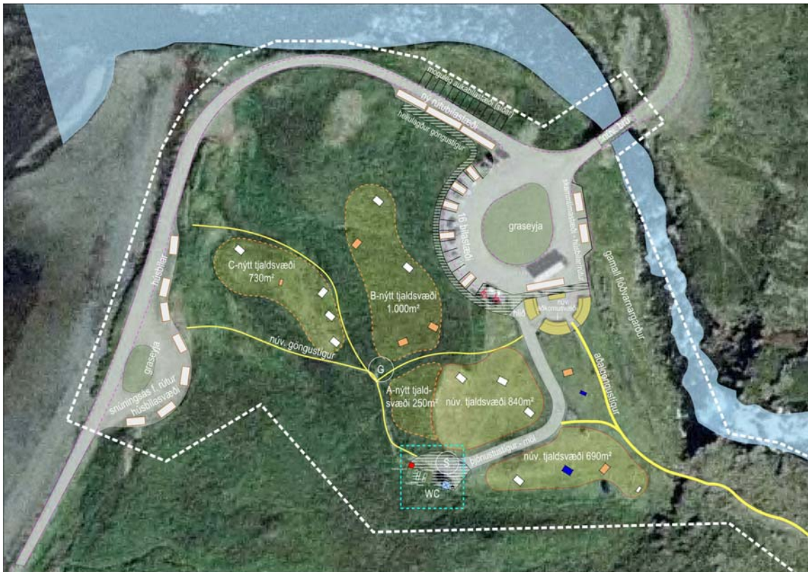
Mynd 6.1 – Tjaldsvæði og salernisaðstaða. Deiliskipulagsmörkin eru hvít stípuð lína. Sjá nánar deiliskipulagsupprátt sem fylgir með greinargerð og er hluti deiliskipulagsins.

Skv. reglugerð um hollustuhætti nr. 941 / 2002 segir að fjöldi fullbúinna snyrtinga á tjaldsvæðum skulu vera a.m.k. tvær fullbúnar snyrtingar, þar af önnur ætluð fötluðum og ekki færri en eitt salerni fyrir hverja 200 gesti umfram fyrstu. Að öðru leyti skulu byggingar og staðarval þeirra vera í samræmi við gildandi skipulags- og byggingarreglugerð.