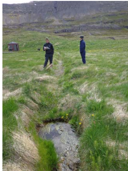
Mynd 6.4 – Náttúrulegt sigvatn undan hlíðum fjalla, nær tjaldsvæðinu er jarðvatnið leitt í framræsluröri en neðar rennur það í opnum skurði til sjávar.