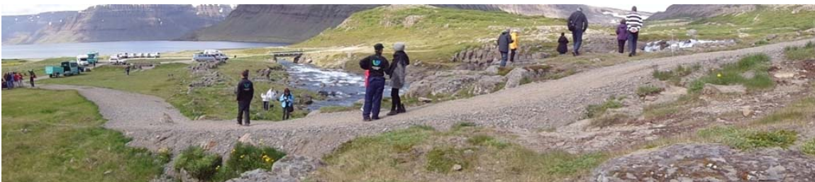
Mynd 6.6 – Neðsta brekka á göngustíg frá tjaldsvæði upp með fossum. Þessa brekku er ráðgert að gera þannig úr garði að hún sé aðgengileg fyrir alla.

Heimilt er að merkja göngustíga og setja upp upplýsingaskilti í grennd við fossa og aðra áhugaverða staði sem talið er æskilegt að merkja. Leitast skal við að halda fjölda og stærð skilta í lágmarki en þau skilti sem sett verða upp skulu vera samræmd hvað varðar útlit og efnisval. Þess skal gætt að þeim sé vel við haldið og að gefnar séu sem nákvæmastar upplýsingar um svæðið og nágrenni þess, sérstaklega með tilliti til öryggis á svæðinu. Fyrirhugað er að gera brekkuna sem liggur upp frá tjaldsvæðinu hjólastólaferna og þarf því að auka við þá fyllingu sem fyrir er eða leiða göngustíginn í „zik-zak“ sneiðing upp brekkuna. Endanlegt efnisval á stígum ræðst af áherslum Umhverfisstofnunar og Umhverfisnefndar Ísafjarðarbæjar þegar endanlegt mat er lagt á aðgengi áningarstaða og hvaða kröfur gilda um slíkt. Almennt séð má þó gera ráð fyrir að stígar verði annaðhvort malarlagðir eða malbikaðir þar sem ríkar kröfur eru gerðar um aðgengi f. alla að Ú1 – Hrísvaðsfossi og Kvíslarfossi.