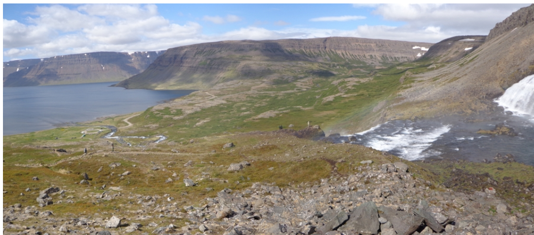
Mynd 7.3 – Yfirlitsmynd, horft frá Dynjanda til norðausturs yfir Arnarfjörð.

Ekki er gert ráð fyrir vöktunaráætlun í formi mælinga eða rannsókna af neinu tagi, en fylgst skal með frárennslismálum og sjá til þess að losun tanka eða rotþróa sé framfylgt.