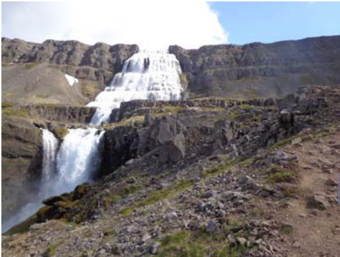
Mynd 7.2 – Strompgljúrafoss og Dynjandi ofanvið.

Metið var hvort áætlunin hefði áhrif á jarðmyndanir og jarðveg, hugsanlega jarðvegsrof og gróður. Jarðrask vegna byggingarframkvæmda er haldið í lágmarki og er mjög