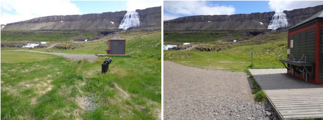
Mynd 6.3 – Núv. rotþró við salernishús (t.v) og vaskar og pallur við salernishús t.h.

Seyru frá þurrsalernum skal fargað skv. 13. og 14. gr. 3. kafla í reglugerð 799/1999. Seyran er geymd í lokuðum tönkum sem komið er fyrir ofan í jörðu og þess vandlega gætt að ekki vætli frá þeim út í aðliggjandi jarðveg um leið og þeir eru tæmdir. Stærð hvers tanks skal ávallt vera í samræmi við notkun og fjölda þurrsalerna. Fyrirhugað þurrsalerni er staðsett í námunda við núv. salerni (sjá uppdrátt).