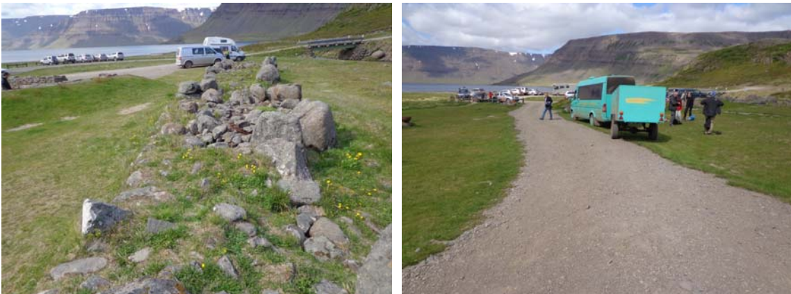
Mynd 5.3 – horft yfir gamlan flóðvarnargarð t.v. og aðkomustíg að tjaldsvæði t.h.

Skipulagsfulltrúi Ísafjarðarbæjar mun senda eftirtöldum aðilum málið til umsagnar á vinnslu- og auglýsingatíma: Skipulagsstofnun, Umhverfisstofnun, Minjaverði Vestfjarða, Heilbrigðiseftirliti, og landeiganda Rarik.