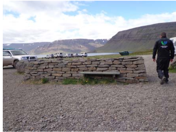
Mynd 6.2 – Núv. salernisskáli og hlaðinn veggur í aðkomusvæði frá árinu 1996.

Núverandi tjaldsvæði er um 1.500m 2 (30 tjöld) að stærð en fyrirhugað stækkun þess er um 2.000m 2 og til að byrja með verður það stækkað um hluta sem merktur er A (250m 2 ). Samanlögð stærð tjaldsvæðisins verður því um 3.500m 2 eða um 70 tjöld (m.v. 50m 2 pr. tjald). Auk þessa er nú sköpuð aðstaða fyrir um 10 húsbíla, 4 rúturbíla og 16 smábílastæði, þar af 2 sérmerkt f. hreyfihamlaða. Auk þess eru lögð til 12 aukabílastæði ef á þarf að halda og eru þau sýnd norðan vegarins þegar komið er yfir ána.