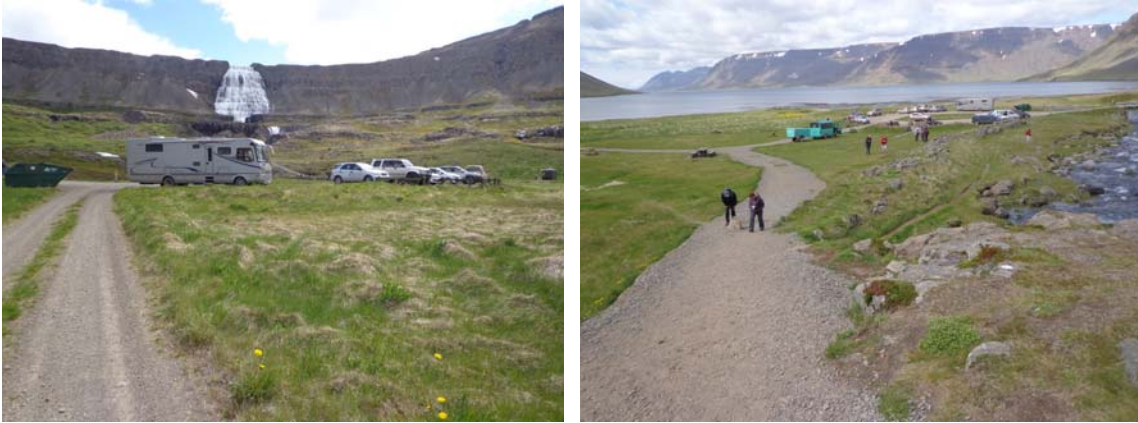
Mynd 1.1 – horft á aðkomu og bílastæði t.v. og til norðurs yfir núv. tjaldsvæði (th).

Bæjarstjórn Ísafjarðarbæjar hefur samþykkt deiliskipulag Dynjanda við Arnarfjörð. Deiliskipulagið er í samræmi við Aðalskipulag Ísafjarðarbæjar 2008-2020 og hefur málsmeðferð verið skv. skipulagslögum að undangenginni skipulags- og matslýsingu, kynningu á henni og samþykkt.