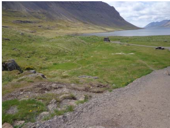
Mynd 4.1 – Aðkoma og yfirlitsmynd á núv. tjaldsvæði.