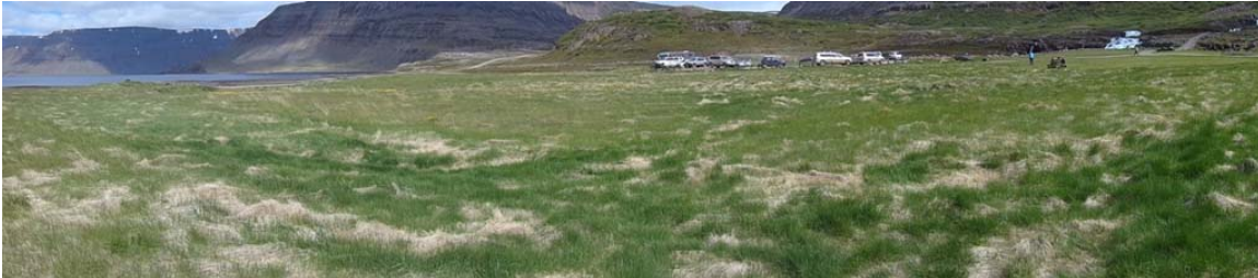
Mynd 6.5 – Horft til austurs í átt að bílastæði og tjaldsvæði. Gamalt engi sem vel má nýta sem framtíðar tjaldsvæði.

Óheimilt er að gróðursetja plöntur eða sá fræjum innan náttúruvættisins. Öllu jarðraski skal halda í lágmarki við útfærslu deiliskipulags. Það jarðrask sem er óhjákvæmilegt skal lagfært jafnóðum og gróður færður í fyrra horf eins og frekast er hægt.