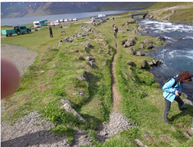
Mynd 7.1 – Ferðamenn í og við árbakka, gamall flóðvarnargarður á milli ár og túns.

Lagt var mat á það hvort framkvæmdin hefði áhrif á heilsu og öryggi ferðamanna. Sú aðstaða sem fyrir hendi er við Dynjanda er mikilvæg vegna þeirrar ferðamennsku sem þar er. Vaxandi ferðamannapungur gerir það að verkum að nú þarf að bæta aðstöðuna, bæði sumar og vetur. Einungis lítill hluti þeirra ferðamanna sem koma að Dynjanda gista á tjaldsvæðinu en húsbílum hefur fjölgað og tilfinnanlegur skortur hefur verið á bílastæðum f. þá. Þörf er á að efla getu staðarins til að taka á móti vaxandi ferðamannastraumi.