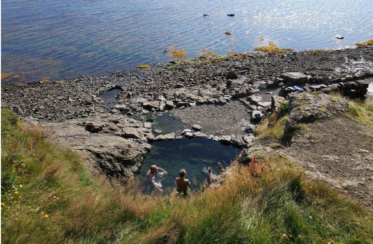
Mynd 28: Hellulaug í Vatnsfirði. Myndin er tekin á háflóði og er fengin á Google Maps. "Hellulaug". Ljósmyndari: Frantxo Monteja.

laugarinnar. Þeir leggja bílum sínum í kant þjóðvegarins neðan orlofsbyggðarinnar í Vatnsfirði þar sem blindhæð er og stofna sjálfum sér og öðrum þannig í hættu. Umhverfisstofnun hefur reynt að fá staðsetninguna fjarlægða af Google Maps en hefur ekki uppskorið árangur. Tagið er enn til staðar og þar má finna 42 umsagnir til viðbótar við hinar 81. 111