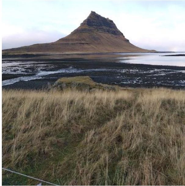
Mynd 5: Kirkjufell frá útsýnisstað við Grundarfjörð. Slóði í fjöruna er greinilegur.

Kolgrafafjörður : Við Kolgrafafjörð er áningarstaður í umsjón Vegagerðarinnar. 32 Þar er gott bílaplan með upplýsingaskiltum um síldardauða í firðinum og söguskilti um Eyrbyggju, áningarborð og grjóthleðsla. Skiltin eru fræðandi en yfir þeim er plasthlíf sem hrím sest á í frosti og nýtast ekki nema áhugasamir skafi þau. Á sama stað er einnig kort um gönguleiðir á svæðinu en það er ólæsilegt. Af bílaplaninu er gott útsýni yfir Kolgrafafjörð og gyrt er fyrir möguleika á göngu í fjöruna. Á Google Maps er staðurinn merktur inn sem „Kolgrafafjörður Viewpoint“ og þar hafa 61 gefið staðnum umsögn og 4,7 stjörnur af fimm mögulegum. 33