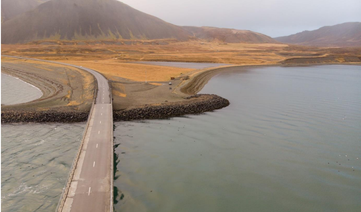
Mynd 7.: Áningarstaður við Kolgrafafjarðarbrú. Fyrir miðri mynd sést móta fyrir stöku áningarborði.

fuglaskoðunar en mikið er af æðarfugli á firðinum og öðrum fuglum yfir sumartímann. Stutt er í fjöru og er gönguhlið á girðingu til að auðvelda aðgengi. Brúin sjálf virðist einnig vera nokkurt aðdráttarafi ef marka má ljósmyndir og umsagnir ferðamanna á Google Maps þar sem 29 aðilar hafa tjáð sig um staðinn og gefa honum 4,6 stjörnur af fimm mögulegum. Tveir umsagnaraðilar minnst meðal annars á að staðurinn sé tilvalinn til sela- og hvalaskoðunar. Einn minnir þá sem ætla að hafa viðdvöl þarna að stöðva ekki bifreiðar sínar á brúnni sjálfri svo vera má að einhverjir hræðist hallann niður á planið eða telji sig ná betri myndum þaðan. 35