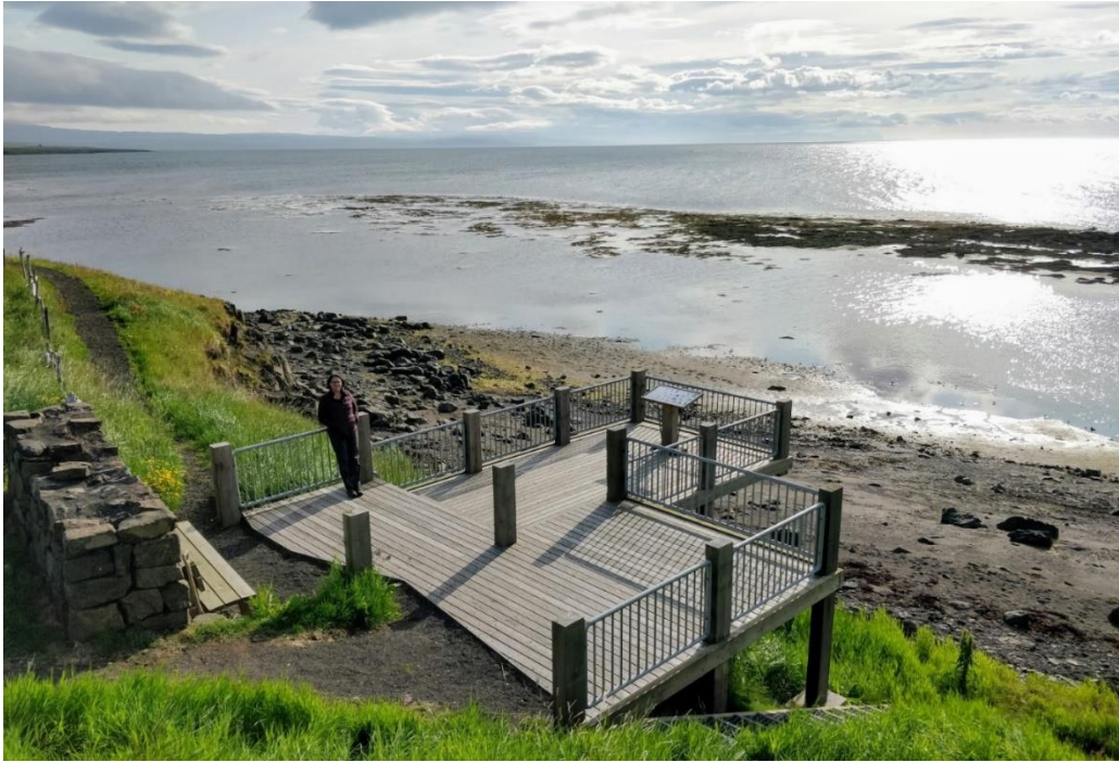
Mynd 14: Fuglaskoðunarpallur við Búðardal. „The Castle“.

Selir í Búðardal : Við höfnina í Búðardal eru tveir selir í lítilli laug sem á sínum tíma var bjargað frá því að vera aflífaðir í Húsdýragarðinum í Reykjavík. 74 Laugin er staðsett nálægt fjöru á uppbyggðu svæði og náttúrunni í umhverfinu stafar ekki hættu af álagi vegna ferðamanna eins og sjá má á mynd 15. Staðurinn hefur verið merktur á Google Maps sem „Beautiful Seals“ þar sem finna má 78 umsagnir ferðamanna sem gefa honum 2,5 stjörnur af fimm mögulegum. Þeir ferðamenn sem upplýstir eru um sögu selanna og það að íslensk lög leyfa ekki að þeim sé sleppt út í náttúruna virðast jákvæðir gagnvart staðnum. Aðrar umsagnir eru mjög neikvæðar og helst gremst ferðamönnum aðbúnaður dýranna þar sem þeir eru meðvitaðir um að frjálsir selir lifa í sjónum sem er skammt undan. 75