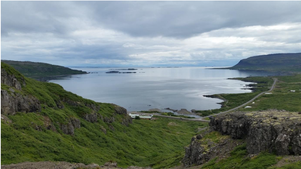
Mynd 27: Vatnsfjörður. Hótel Flókalundur er fyrir miðri mynd, hægra megin við miðju sjást vegamót Vestfjarðavegar og Barðastrandarveggar. Lengst til hægri sést glitta í neðstu hús í orlofsbyggðinni. Myndin er fengin af Google Maps „Hótel Flókalundur“. Ljósmyndari: Jason Fritz.

Hótel Flókalundur : Í friðlandinu Vatnsfirði er rekið sumarhótel og tjaldstæði. Þar er veitingahús, bensínafgreiðsla, verslun og nálæg sumarhúsabyggð þar sem finna má steypa sundlaug. Svæðið er í nálægð við fjöruna og sækir ferðafólk talsvert í hana.