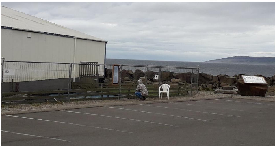
Mynd 15: Selir í Búðardal. „Beautiful Seals“ Vinstra megin við miðju sést tjörninn innan grindverks, hægra megin sést söguskilti á bílastæðinu.

Selir í Búðardal : Við höfnina í Búðardal eru tveir selir í lítilli laug sem á sínum tíma var bjargað frá því að vera aflífaðir í Húsdýragarðinum í Reykjavík. 74 Laugin er staðsett nálægt fjöru á uppbyggðu svæði og náttúrunni í umhverfinu stafar ekki hættu af álagi vegna ferðamanna eins og sjá má á mynd 15. Staðurinn hefur verið merktur á Google Maps sem „Beautiful Seals“ þar sem finna má 78 umsagnir ferðamanna sem gefa honum 2,5 stjörnur af fimm mögulegum. Þeir ferðamenn sem upplýstir eru um sögu selanna og það að íslensk lög leyfa ekki að þeim sé sleppt út í náttúruna virðast jákvæðir gagnvart staðnum. Aðrar umsagnir eru mjög neikvæðar og helst gremst ferðamönnum aðbúnaður dýranna þar sem þeir eru meðvitaðir um að frjálsir selir lifa í sjónum sem er skammt undan. 75