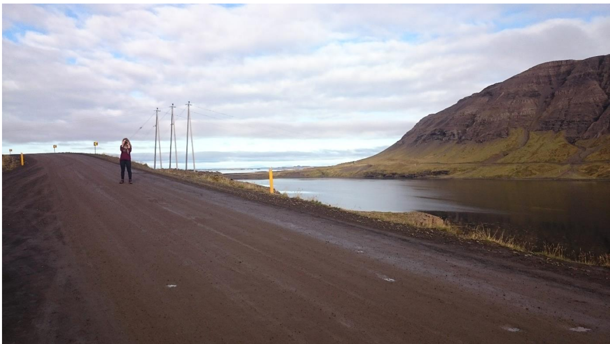
Mynd 12: Ferðamaður mundar vélina á miðjum vegi við krappa beygju í Álftafirði. Vinstra megin má sjá jaðar útskotsins. Myndin er fengin af Google Maps "Álftafjörður". Ljósmyndari Bartosz Gierak.

Álftafjörður: Við norðausturhorn Úlfarsfells í Álftafirði vestanverðum er útskot á veginum þar sem ferðamenn stöðva bifreiðar sínar og njóta útsýnis yfir fjörðinn. Nokkuð bratt er þaðan í fjöruna en þó má draga þá ályktun af ljósmyndum á Google Maps að einhverjir príli niður að sjónum. Staðurinn hefur verið merktur inn sem „Álftafjörður“ en þar eru einungis tvær umsagnir, þó mun fleiri hafi sett inn ljósmyndir. Bletturinn fær fimm stjörnur af fimm mögulegum. 57 Fjörðurinn ber nafn með rentu og er oft þéttsetin álfum yfir sumartímann. Bílum er lagt víða um fjörðinn á sumrin, ekki síst í botni hans. Útskotið er þó hið eina sem hefur verið merkt af ferðamönnum á Google Maps.