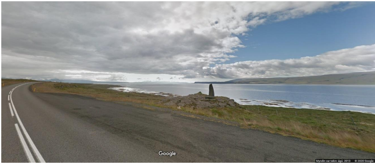
Mynd 16: Ljárskógar, útskot og áningarstaður Vegagerðarinnar. Fyrir miðri mynd er minnismerki um Jón Jónsson, útsýni er út á Hvammsfjörð.

Ljárskógar: Við Ljárskóga norðan Búðardals er áningarstaður Vegagerðarinnar. Þar eru engir innviðir ss. borð eða skilti, einungis útskot á vegi þar sem hægt er að leggja bifreiðum. 76 Við útskotið sjávarmegin er minnisvarði um Jón Jónsson, skáld og söngmann. Um 150 m eru í fjöruna frá veginum.