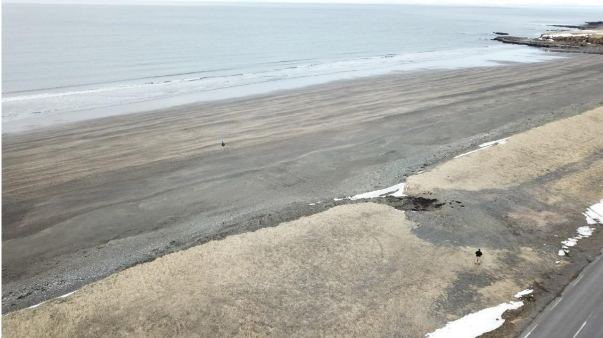
Mynd 2: Mávahlíðarrif. Á myndinni sést skarðið þar sem stórir bílar geta keyrt fram af. Myndin er fengin af Google Maps "Bonica platja negra amb mala mar", ljósmyndari: Marek Stachowiak.

Mávahlíðarrif: Falleg fjara í nálægð þjóðvegjar þar sem engir innviðir eru til staðar. Ferðamenn stöðva bifreiðar sínar og leggja þeim gjarnan á litlu malarsvæði fjörumegin eða í vegöxl sem getur skapað slysaættu. Norðarlega við sandinn er skarð í fjörubarðið sem stórir og vel útbúnir bílar geta keyrt í gegnum og niður á sandinn. Þar má stundum sjá bílför. Á Google Maps er staðurinn merktur sem „Bonica platja negra amb mala mar“ sem mun vera katalónska og útleggst á íslensku sem „falleg svört strönd með vondum sjó“. Þar er að finna átján umsagnir ferðamanna og staðurinn er með 4,7 stjörnur af fimm mögulegum. Eina umsögn má jafnframt finna undir heitinu „Klausidóttirsfjara“. Umsagnaraðilar nefna m.a. að úr fjörunni sé útsýni fallett og þar sé gott að teygja úr þreyttum fótum. 22