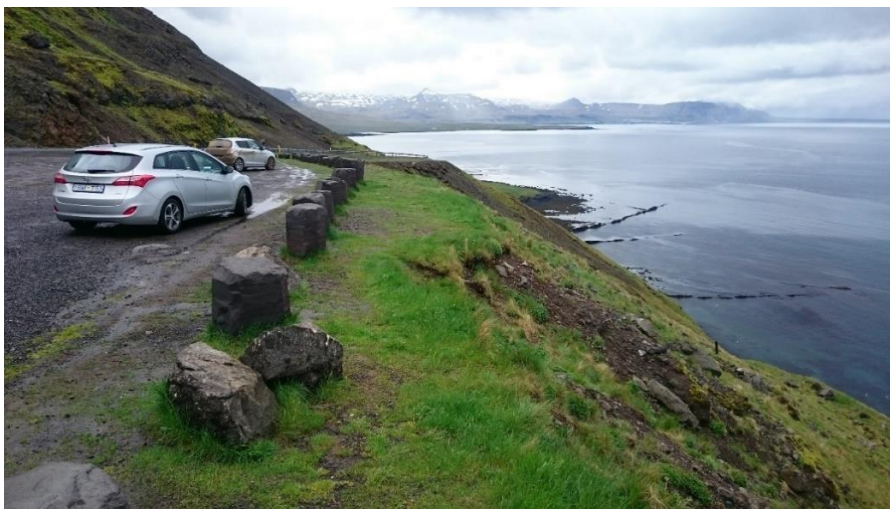
Mynd 1: Áningarstaður við Búlandshöfða.

Búlandshöfði: Við fjallið Búlandshöfða er skipulagður áningarstaður í umsjón Vegagerðarinnar þar sem finna má bílastæði, áningarborð og skilti. 20 Aðstaðan er mikið notuð en frá bílastæðinu er hægt að njóta útsýnis yfir Breiðafjörð, Ólafsvík og Snæfellsjökul eins og sjá má á mynd 1. Bílastæði eru ekki merkt og því er líklegt að eitthvert öngþveiti geti myndast þar á sumrin þegar umferð er meiri. Bílastæðið er afmarkað með stuðlabergi og fram af því er brött grasi vaxin hlíð að fjörunni sem virðist torfarin og ólíklegt að margir gangi þar niður. Á Google Maps má finna 87 umsagnir ferðamanna um staðinn sem þar nefnist „Búlandshöfði View Point“ og þeir gefa svæðinu 4,6 stjörnur af fimm mögulegum, flestir hæla útsýninu en margir taka fram að þetta sé ekki áfangastaður í sjálfu sér. 21