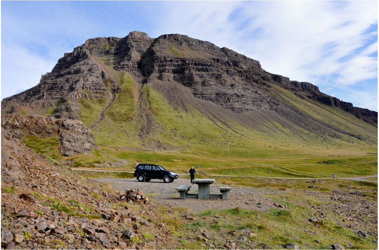
Mynd 17: Klofningur. Bílastæði og áningarborð við fjallið Klofning.