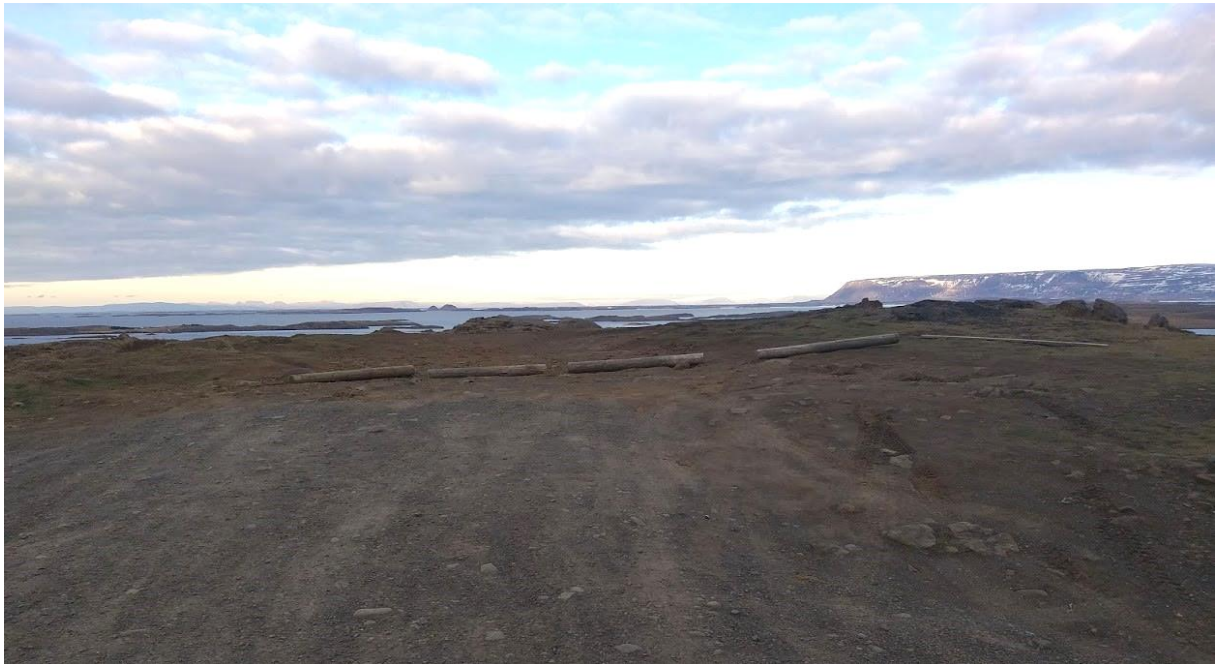
Mynd 13: Háls á Skógarströnd. Á mynd má sjá bílastæði afmarkað með trédrumbum. Hinu megin þjóðvegur er áningarborð neðarlega í hlið.

Háls á Skógarströnd : Útsýnisstaður sem er merktur við þjóðveg. Blindhæð er við hálsinn þar sem ferðamenn eru hvattir til þess að stoppa og bílastæði er afmarkað með liggjandi staurum sjávarmegin en áningarborð er fjallsmegin. Hætta getur skapast þegar gestir fara yfir veginn við blindhæðina til að komast að borðinu. Töluvert traðk er á svæðinu og sér á gróðri en engir skipulagðir göngustígar eru til staðar. Útsýnisstaðurinn er mikið notaður af gestum og bílastæðið annar ekki alltaf fjöldanum.