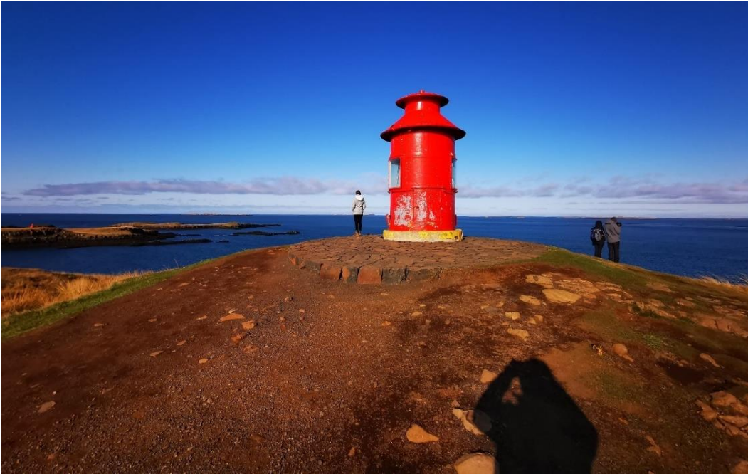
Mynd 10: Vitinn í Súgandisey.

koma en mannvirkisins. Margir mæla með uppgöngunni, sérstaklega ef fólk á leið um staðinn hvort eð er, nokkrir vara við erfiðum vetraraðstæðum. 55 Höfnin ein og sér er einnig aðdráttarafi í Stykkishólmi og finna má 26 umsagnir um hana og ferjuna Baldur á Google Maps.