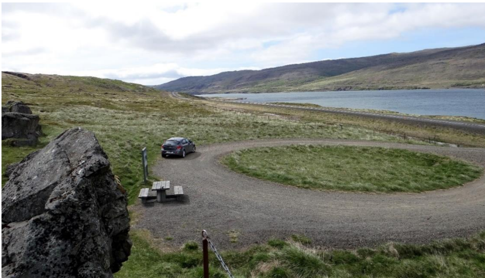
Mynd 22: Minningarreitur um Matthías Jochumsson í Þorskafirði. „Rastplatz Kollafjörður“ [svo].

Þorskafjörður: Við jörðina Skóga í Þorskafirði er minningarreitur um Matthías Jochumsson í umsjón Vegagerðarinnar. 88 Þar má finna stórt snúningsplan, áningarborð og söguskilti. Um 150 metrar eru í fjöruna frá bílplaninu en ekkert sýnilegt álag á gróðri sem bendir til þess að ásókn sé fjöruna. 89