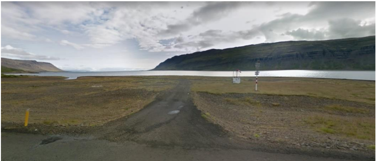
Mynd 26: Flugbrautin við Eyri í Kollafirði.

Eyri í Kollafirði : Við gamla flugbraut við Eyri í Kollafirði er ekið utan slóðans beggja megin til að komast á bílum í fjöruna. Eitthvað er um utanvegaakstur vestanmegin sem er líklega afleiðing af því að vegslóðinn endar þar og ekkert afmarkað svæði til að snúa við er til staðar. Nálægt Eyri er stýrishús af gömlum báti grafið í möl og er það myndefni hjá ferðamönnum. Eyri stendur mjög nálægt sjó og aðgengi að fjöru er auðvelt.