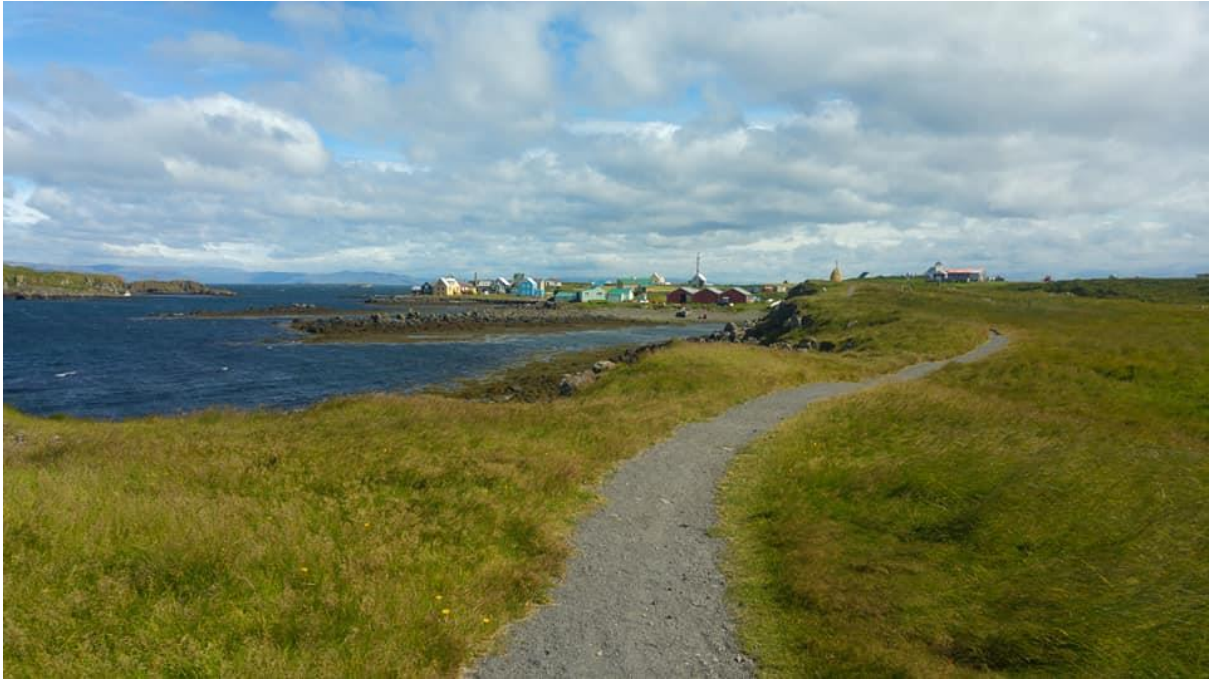
Mynd 23: Göngustígur sem lagður hefur verið um Flatey utan friðlands, þorpið sést fjær.