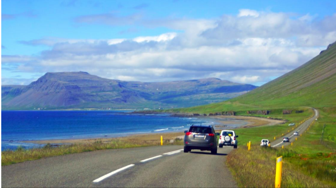
Mynd 30: Þjóðvegur neðan Rauðsdals á Barðaströnd. Hægra megin við miðju sést sandfjaran og fjær teygja Reiðskörð sig út á Breiðafjörð. Líklegt má telja að bílalestin hafi komið úr Baldri og á myndinni sést hvar verið er að aka bíl niður að fjörunni. Ljósmynd fengin af Google Maps. "Barðastrandarvegur Road, Westfjords". Ljósmyndari: Andrey Sulitskiy.

ferjan Baldur er nýlögst að landi með farþega. Af þjóðveginum er greinilegur gamall slóði sem er notaður en engin bílastæði eru til staðar. Vestast í fjörunni eru Reiðskörð, berggangur sem gengur út á Breiðafjörðinn, og er áhugaverður bæði fyrir sakir jarðfræði og sögu en þar var áður aftökustaður. Ábúendur í Rauðsdal hafa gert tilraunir til að loka slóðanum þegar fjær dregur. Undir grasbörðum í fjörunni má oft finna pappír og blautþurrkur.