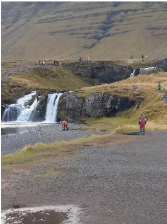
Mynd 3: Ferðamenn utan stíga við Kirkjufellsfoss í október.

Á Google Maps er að finna 1.950 umsagnir um Kirkjufellsfoss og gestir gefa staðnum 4,7 stjörnur af fimm mögulegum. Mjög margir vísa til sjónvarpsþáttanna Game of Thrones og sumir segja fjallið vera mun stórfenglegra en þeir áttu von á og eitt þeirra fyrirbæra sem ferðamenn á Íslandi verði að sjá (e. „must see“). Í nýlegum umsögnum er talað um að bílastæðið sé stórt og þægilegt og stuttur gangur þaðan í stórfenglegt útsýni. Aðrir fjalla um að allt of margir ferðamenn séu á svæðinu, stígar séu hættulegir í hálfu og vart þverfótað fyrir sjálfsmyndatökufólki (e. selfie). 28 80 gestir skrifa umsagnir um bílastæðið við Kirkjufell í tveim tögum, annað fær 3,8 stjörnur og hitt 4,1. Kirkjufellsfoss var ástandsmetinn samhliða þessari úttekt og svæðið kom ágætlega út. 29