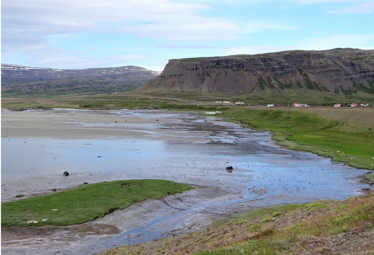
Mynd 29 : Myndin er tekin frá áningarstaði við bæinn Kross og sýnir innsta hluta Hagavaðals, hægra megin við miðju fjær sést sundlaugin í Laugarnesi í fjörunni.

náttúrugrjóti. Lítt afmarkað bílastæði er við fjöruna og talsverður bratti niður að því. Á sléttunni ofan eru upplýsingaskilti sem segja frá lauginni og sundkennslu á Barðaströnd. Sundlaugin er auglýst opin á sumrin en er þó aðgengileg allt árið. Þaðan er fallett útsýni yfir Breiðafjörð og náttúruna í umhverfinu og sumir gesta nýta tækifærið og vaða í sjónum. Til stendur að bæta umhverfi laugarinnar með styrk frá Framkvæmdasjóði ferðamannastaða. 115 Á Google Maps hefur laugin verið merkt inn sem „Sundlaugin Birkimel“ og þar eru 52 umsagnir um staðinn. Gestir gefa lauginni 4,3 stjörnur af fimm mögulegum og mörgum er tíðrætt um útsýnið. 116