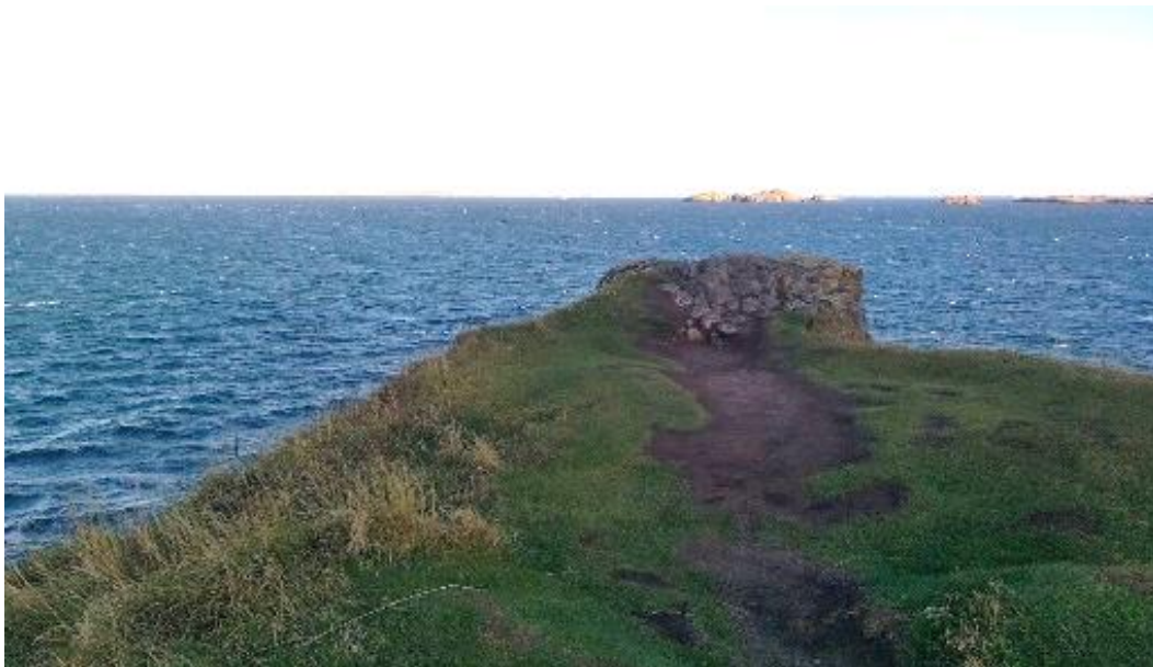
Mynd 11: Súgandisey. Þarna sjást ummerki þess að ferðamenn sækja út á brúnir.