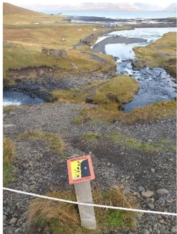
Mynd 4: Tákmynd sem varar við skriðhættu við göngustíg við Kirkjufellsfoss.

Útsýnisstaður vestan Grundarfjarðarbæjar : Við Grundarfjarðarbæ er upplýsingastaður í umsjón Vegagerðarinnar. 30 Þar er lítið bílaplan sem liggur í sveig og rúmar fimm til sex bíla. Á staðnum eru tvö góð fræðsluskilti, annars vegar um Kirkjufell, einkum jarðfræðina, og hins vegar um fuglalíf á svæðinu. Útsýni að fjallinu er gott en frá planinu er stutt í fjöruna og þar hefur myndast slóði gegnum gras og móa þrátt fyrir reipi til afmörkunar eins og sést á mynd 5. Áningarstaðurinn er merktur sem „Kirkjufell Viewpoint“ á Google Maps og þar má finna 79 umsagnir og 4,7 stjörnur af fimm mögulegum. Flestum umsagnaraðilum er þó tíðræddara um fjallið og fossinn en útsýnisstaðinn sjálfan og innviði hans. 31