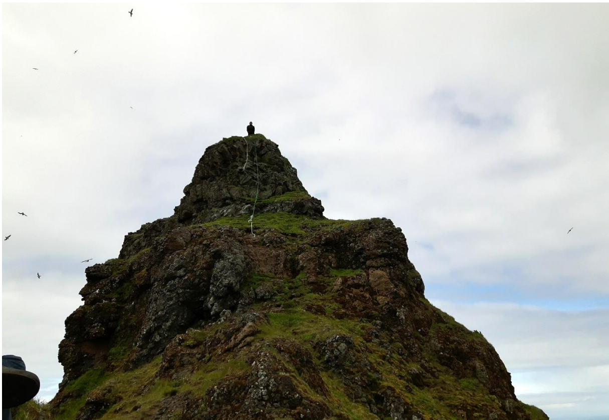
Mynd 9: Á myndinni sést uppgangan á topp Kirkjufells, kaðlar sjást hanga niður kletta fyrir miðjum tind.

Kirkjufell var ástandsmetið og var einkunn í meðallagi en helst er það skortur á skipulagi áfangastaðarins sem dregur svæðið niður í einkunn. 43 Það mun þó standa til bóta svo sem ofan greinir.