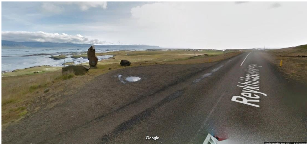
Mynd 20: Útskot Vegagerðarinnar nálægt Miðhúsum. Myndin er fengin af Google Maps, minnismerki um Gest Pálsson, Reykhólasveitarvegur Street View.

Minnismerki um Gest Pálsson : Skammt frá bænum Miðhúsum í Reykhólahreppi er útskot sjávarmegin vegar með minnismerki um Gest Pálsson. 85 Um 450-500 metrar eru í fjöruna þar sem styst er en ummerki þess að fólk leiti í fjöruna eru ekki greinanleg.