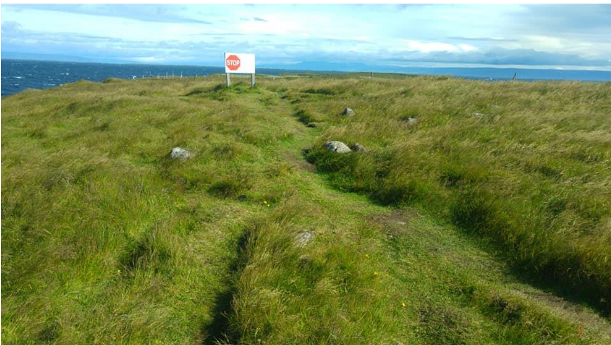
Mynd 24: Innan friðlands hafa ekki verið lagðir stígar, þar eru troðningar til staðar. Fjær sést bannskilti vegna umferðar um friðlýst æðarvarp.