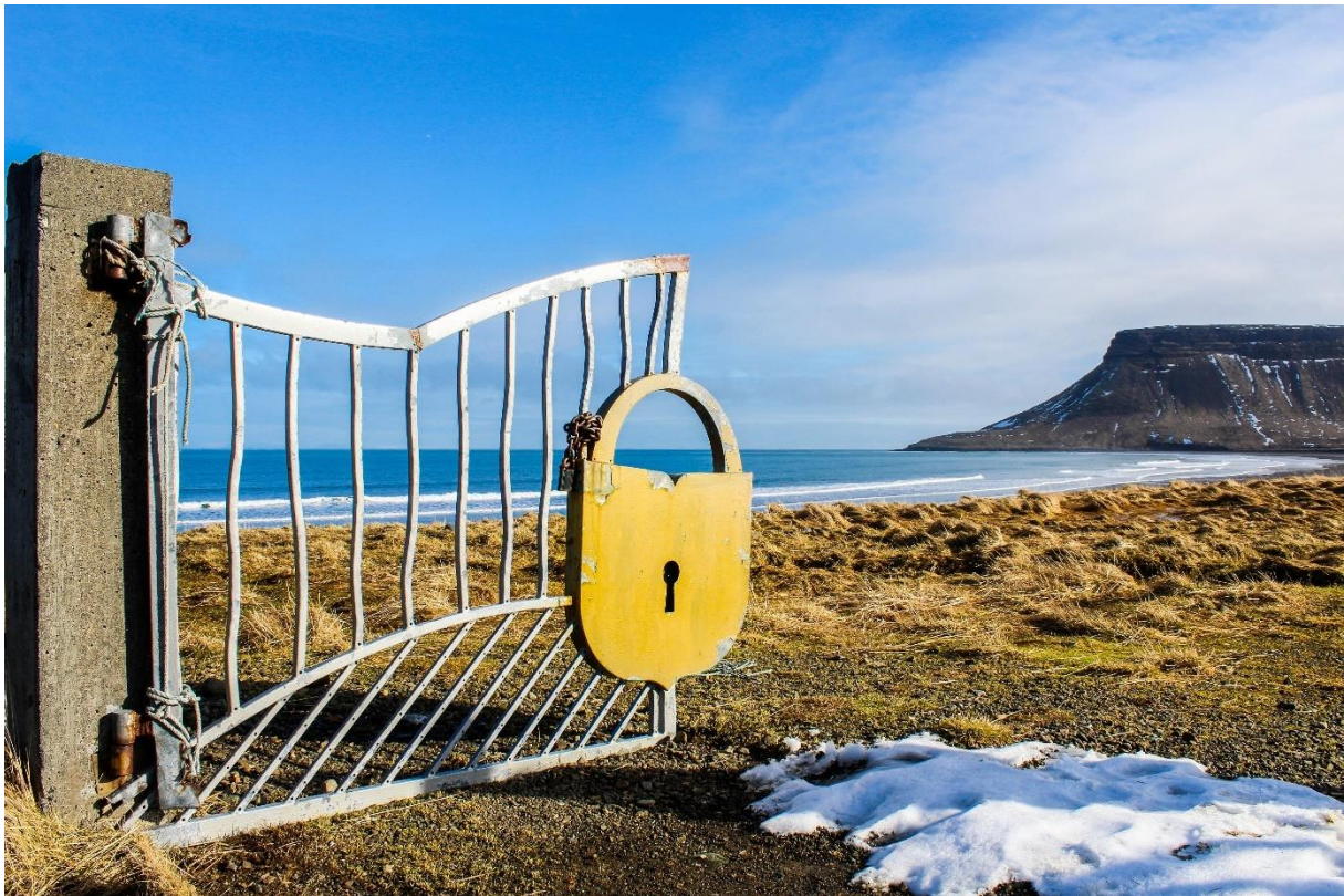
Mynd 8: Hengilás við Háubakka..Ljósmyndin er fengin af Google Maps, „Giant Padlock“. Ljósmyndari: Brittney Johnson.

hægt sé að fara í göngutúr um ströndina og virða fyrir sér kletta og smádýralíf í sandinum. Einhverjir vilja gjarnan vita meira meira um þennan sérstæða hengilás en þarna eru engir innviðir. 36