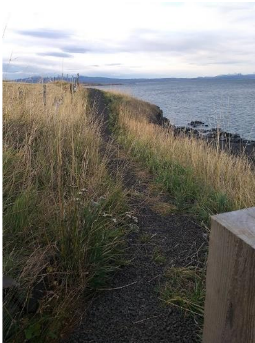
Mynd 19: Göngustígur meðfram fjöruborði innan Búðardals og í nágrenni.

Ein skipulögð gönguleið er við sjávarsíðuna í sveitarfélaginu og liggur hún frá fuglaskoðunarpallinum í fjörunni í Búðardal, meðfram ströndinni og að Laxá sem er sunnan við þorpið. Þessa leið er hægt að ganga fram og til baka eða fara upp með Laxá og eftir göngustíg meðfram þjóveginum inn í þorpið aftur. Stígnum er vel við haldið, efni hefur verið borið í hann og grindur lagðar, sjá mynd 19. Á stöku stað þar sem stígurinn fer um klappir rennur vatn yfir hann sem getur reynst varasamt í frosti. Merkingar skortir, það eru engar upplýsingar um stíginn, hvert hann liggir og hversu langur hann er.