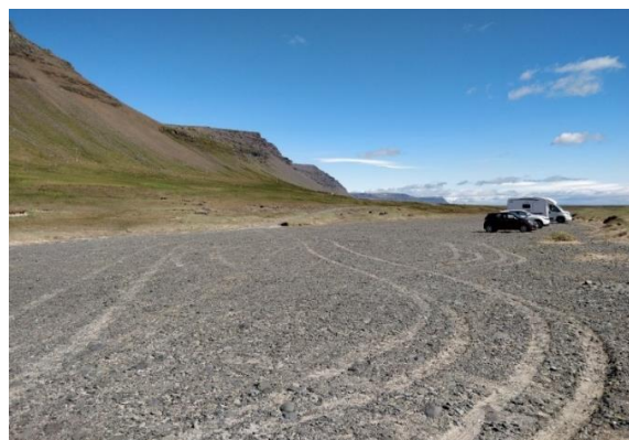
Mynd 31: Við fjöru nálægt Haukabergsvaðli á Barðaströnd, merki um utanvegaakstur sjást. Myndin er fengin af Google Maps "Barðastrandarsandur". Ljósmyndari: SZ.

Aðrar fjörur á Barðastönd : nokkuð ber á því að ferðamenn sækir í ljósar sandfjörur neðan bæjanna Litluhlíðar og Miðhlíðar, allt að Haukabergsvaðli. Þær eru, eins og fjaran við Rauðsdal, aðgengilegar frá þjóðvegi þaðan sem gamlir slóðar eru sjáanlegir en á þessum slóðum var flugbraut forðum. Engir innviðir eru til staðar og eitthvað er um utanvegaakstur í fjörunni eins og sést á mynd 31. Ferðamenn hafa merkt staðinn á Google Maps og ranglega nefnt svæðið „Barðastrandarsandur“. Þar eru ekki nema tvær umsagnir en báðar eru nýlegar. Þessir tveir aðilar gefa fjörunni fimm stjörnur af fimm mögulegum og annar þeirra segir hana betri en hinn fjarlæga Rauðasand. 117