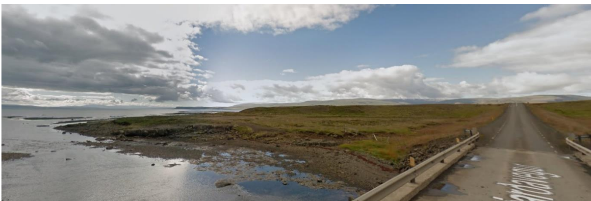
Mynd 18: Brú yfir Fáskrúð til hægrí. Fyrir miðju má sjá hluta slóðans sem liggur í átt að fjöruborðinu hvar ferðamenn tjalda gjarnan.

Fáskrúð : Einn af vinsælli næturáningarstöðum í Dalabyggð er niður með ánni Fáskrúð. Slóði liggur frá vegi norðanmegin við brúna í átt að fjöru. Þar er algengt að sjá tjöld og önnur ferðahýsi þegar kvöldar en þarna er ekki tjaldstæði. Á mynd 18 má sjá slóðann og svæðið þar sem ferðamenn gista.