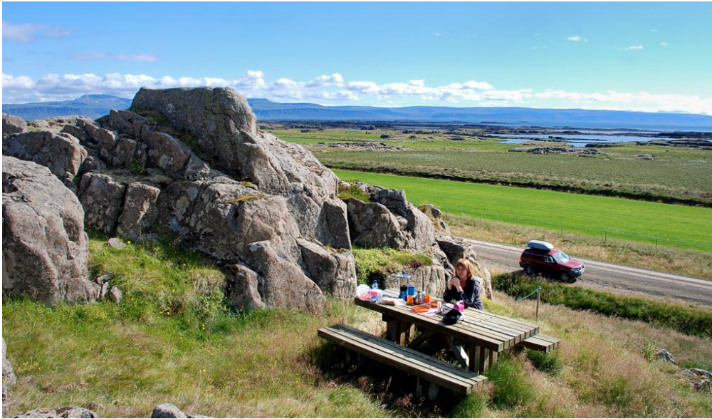
Mynd 21: Áningarstaður Vegagerðarinnar við Miðjanes í Reykhólasveit. „Reykhólar Restaurant“.

Miðjanes: Áningarstaður Vegagerðarinnar við Miðjanes í Reykhólasveit. 86 Þar er eitt áningarborð og um 280 m í fjöru en yfir ræktað land að fara svo ólíklegt má telja að að ferðamenn leiti þangað. Útsýnið yfir skerjgarðana á Breiðafirði er fallett við Miðjanes sem víða annars staðar á þessum slóðum. 87