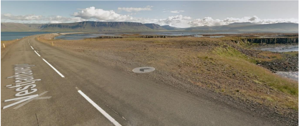
Mynd 25: Mynni Gilsfjarðar norðanvert. Fyrir miðju sést malarplan sem nýtt er til áninga. Fjær sést glitta í Gilsfjarðarbrú.

Höfnin á Stað : Á Reykjanesi er lítil höfn við kirkjustaðinn Stað. Hún hefur verið merkt á Google Maps, þar eru tvær umsagnir og stjörnugjöfin 4,5 af fimm mögulegum. 97