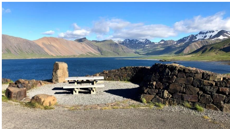
Mynd 6: Áningarstaður við Kolgrafafjörð. Myndin er fengin af Google Maps „Kolgrafafjörður Viewpoint“. Ljósmyndari: Michel Grandjean.

Kolgrafafjörður : Við Kolgrafafjörð er áningarstaður í umsjón Vegagerðarinnar. 32 Þar er gott bílaplan með upplýsingaskiltum um síldardauða í firðinum og söguskilti um Eyrbyggju, áningarborð og grjóthleðsla. Skiltin eru fræðandi en yfir þeim er plasthlíf sem hrím sest á í frosti og nýtast ekki nema áhugasamir skafi þau. Á sama stað er einnig kort um gönguleiðir á svæðinu en það er ólæsilegt. Af bílaplaninu er gott útsýni yfir Kolgrafafjörð og gyrt er fyrir möguleika á göngu í fjöruna. Á Google Maps er staðurinn merktur inn sem „Kolgrafafjörður Viewpoint“ og þar hafa 61 gefið staðnum umsögn og 4,7 stjörnur af fimm mögulegum. 33