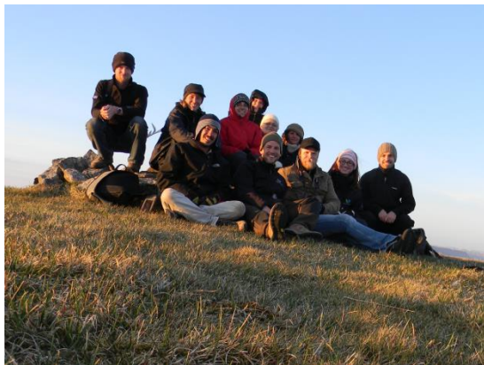
Sjálfbóðaliðar ásamt landvörðum í Sólstöðugöngu.

Sjálfbóðaliðar Umhverfisstofnunar voru í tvær vikur að störfum á Látrabjargssvæðin í sumar. Þetta voru sjálfbóðaliðar frá Bandaríkjunum, Bretlandi, Skotlandi, Þýskalandi, og Austurríki.