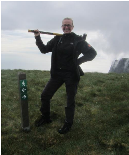
Dagný ofan Geldingsskorardals.

þessum fyrirmælum og margir líta á þetta sem öryggislínu.