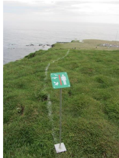
Lína til að afmarka svæði lundans.

Í fyrra sumar gerðu landverðir tilraun með að afmarka varpsvæði lundans á bjargsbrúninni frá vitanum að Ritugjá með hvítu línu. Ástæðan var sú að ferðamenn voru farnir að þjarma verulega að lundanum og einnig að það er hættulegt að standa á brúninni þar sem hún er víða laus í sér. Þetta virkaði vel og ákveðið var að gera þetta aftur í sumar og einnig að setja skilti til leiðbeiningar eins og sést á myndinni hér að ofan. Ferðamenn hafa almennt farið eftir