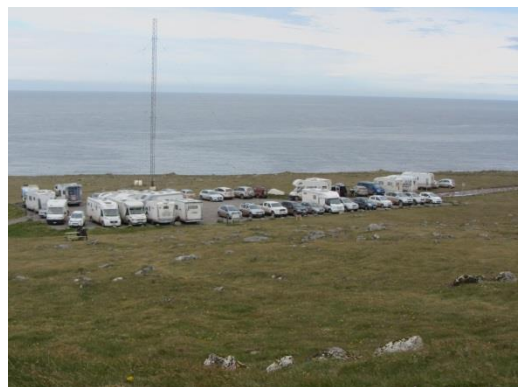
Bílastæði á Bjargtöngum.

Helstu störf landvarða var eins og síðastliðið sumar eftirlit með ferðamönnum, náttúru og dýralífi, ruslatínsla, þrif á salernum á Brunnum ásamt fræðslu og upplýsingagjöf til ferðamanna. Gerð var könnun á fjölda ferðamanna á Bjargtanga í júlí. Miðað var við komur alla daga frá kl. 9 – 21:00. Niðurstöður úr þeim talningum eru að tæplega 11.000 ferðamenn komu á Bjargtanga í júlí. Reikna má því með að í júní-júlí og ágúst hafi rúmlega 30.000 ferðamenn komið. Upplýsinga- og fræðsluskilti sem voru á safninu á Hnjóti voru flutt á Bjargtanga og fest á vegginn á vélarhúsi við vitann. Þetta eru skilti sem upphaflega áttu að vera á Bjargtöngum (sjá mynd á næstu síðu). Einnig voru sett upp skilti sem banna næturdvöl á svæðinu og virðist það hafa skilað sér vel og ekki var vart við að neinn gisti á Bjargtöngum. Síðastliðið sumar voru landverðir stöku sinnum varir við að gestir voru með hunda á Bjargtöngum og skeyttu engu um það þó hundarnir gerðu aðsig að lundanum og jafnvel gerðu tilraun til að grafa upp holur þeirra. Landverðir ræddu þetta við nokkra landeigendur á svæðinu og voru allir sammála um að