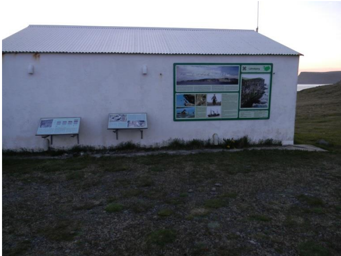
Upplýsinga og fræðsluskilti frá Hnjóti.

banna hunda á Bjargtöngum, sérstaklega á varptíma og sett var upp skilti því til viðvörunar. Í lang flestum tilvikum virða hundaeigendur það og sýna því skilning. Síðasta sumar urðu landverðir varir við að nýjir stígar voru að myndast út frá bílastæði upp að Ritugjá. Í sumar var brugðið á það ráð að setja upp kaðalgirðingu meðfram bílastæðinu að ofan verðu og þannig stýra gangandi umferð inn á megin gönguleið. Það hefur gengið upp og aflögu stígar eru að gróa upp aftur.