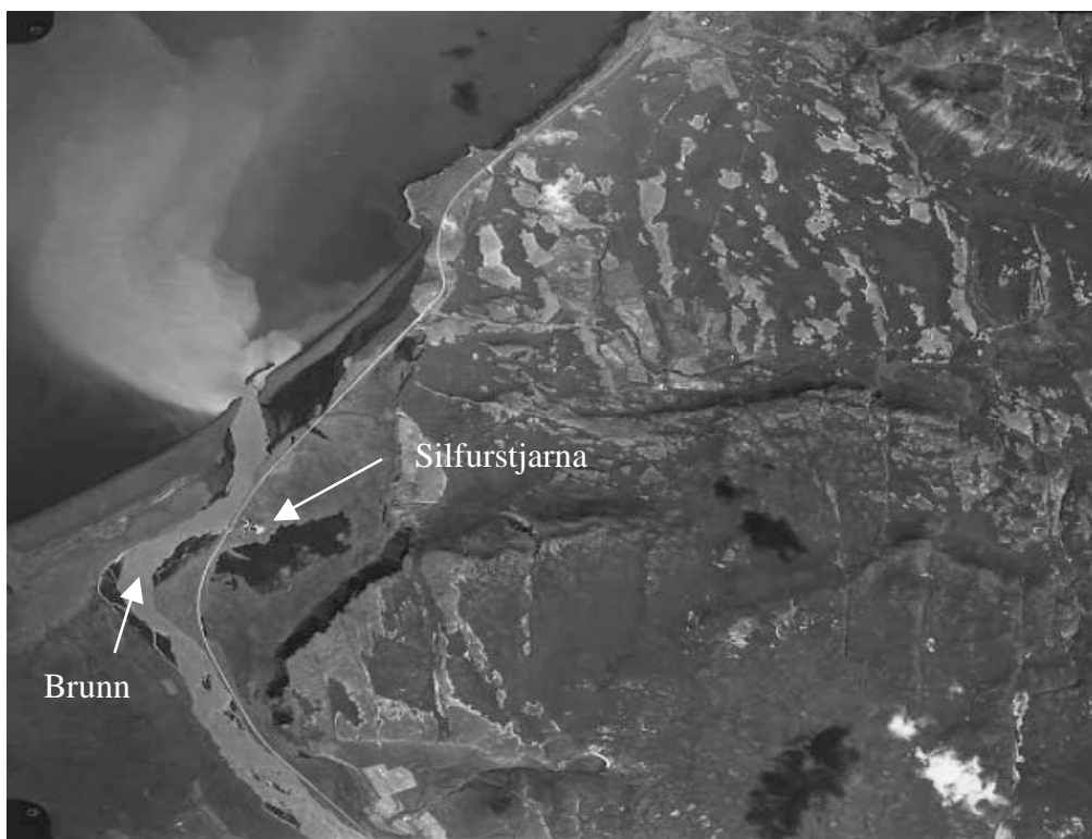
Mynd 2. Gervitunglamynd af Silfurstjörnnunni í Öxarfirði.

Frárennsli stöðvarinnar er veitt í Brunná, en Brunná og Sandá, sem er kvísl úr Jökulsá á fjöllum, renna saman norðan við Klifshaga og bera þaðan nafn Brunnár alla leið til sjávar. Frárennsli stöðvarinnar rennur því í jökulblandað vatn. (sjá mynd 2) Rotþró tekur við frárennsli frá salernum og sláturhúsi. Rotþróin sem er 6 rúmmetrar er tæmd tvisvar á ári.