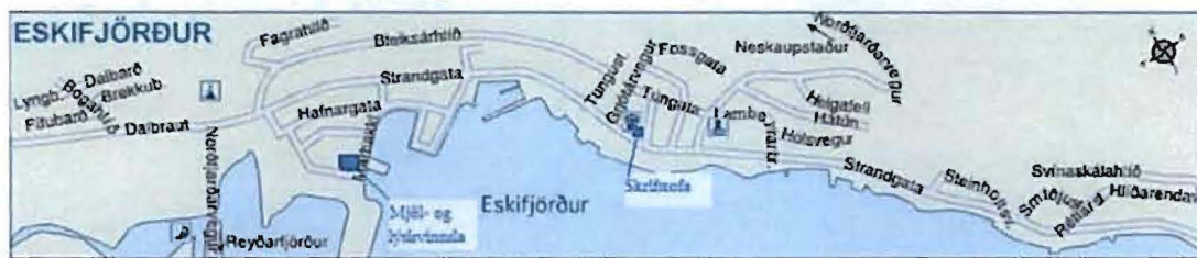
Mynd 1 Yfirlitsmynd af Eskifirði

Mjöl- og lýsisvinnsla Eskju er staðsett á Marbakka sem er iðnaðarsvæði á Eskifirði og skrifstofa fyrirtækisins er staðsett í miðjum bænum líkt og mynd 1 sýnir.