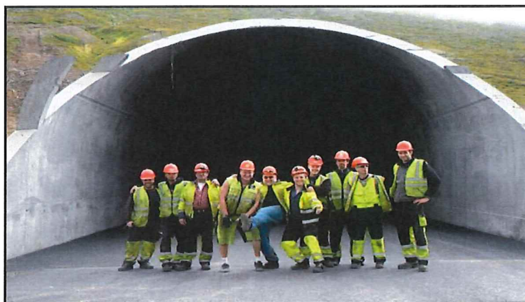
Malbikun Héðinsfjarðarganga lokið haustið 2010