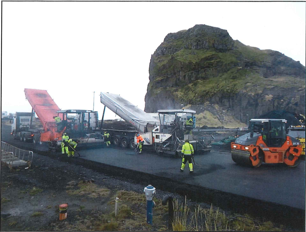
Malbikun í Vestmannaeyjum haustið 2011