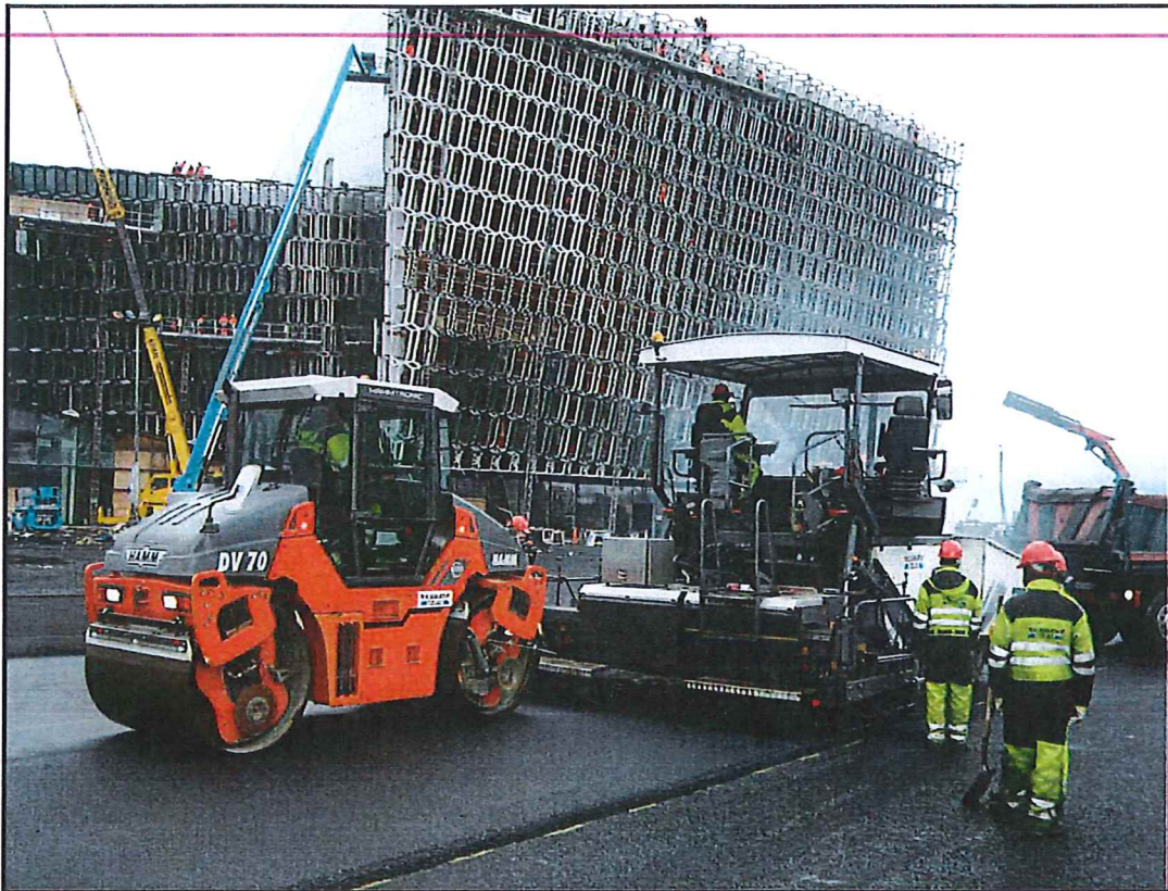
Malbikað við Hörpuna.