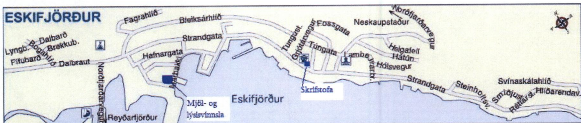
Mynd 1 Yfirlitsmynd af Eskifirði

Mjöl- og lýsisvinnsla Eskju er staðsett við Marbakka sem er iðnaðarsvæði á Eskifirði og skrifstofa fyrirtækisins er staðsett í miðjum bænum líkt og mynd 1 sýnir.