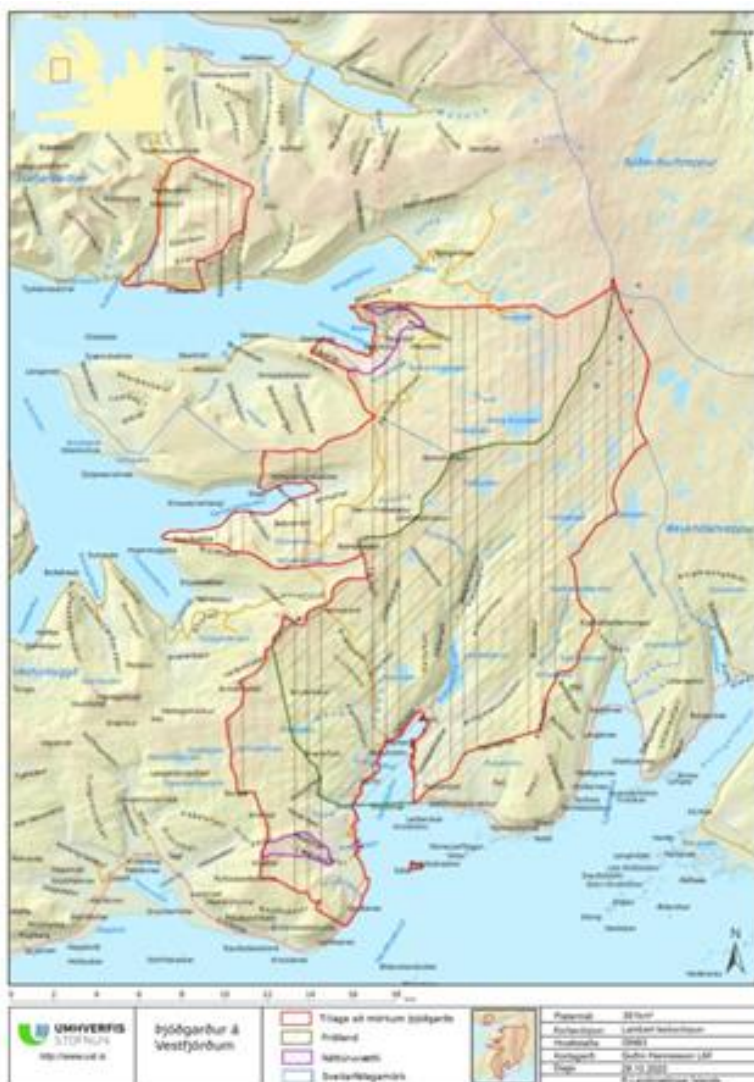
MYND 1 - KORT AF FYRIRHUGUÐUM ÞJÓÐGARÐI Á SUNNANVERÐUM VESTFJÖRÐUM

Á meðfylgjandi korti, mynd 1, má sjá svæðið sem er 349 km 2 að flatarmáli. Svæðið sem um er að ræða eru friðlýstu svæðin Vatnsfjörður, Dynjandi og Surtarbrandsgil, ríkisjarðirnar Brjánslækur, Sperðlahlíð, Dynjandi og Hrafnseyri og einnig er þar jörðin Langibotn sem er í eigu Landgræðslusjóðs 1 .