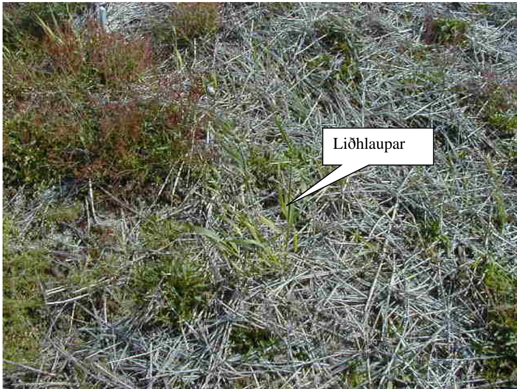
Mynd 5) Liðhlaupar sjáanlegir