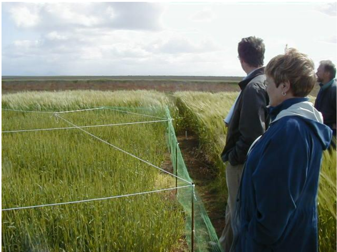
Mynd 12. Erfðabreytt Golden promise, 8 mism línur innan reitsins, línur strengdar yfir til að hindra gæsir.