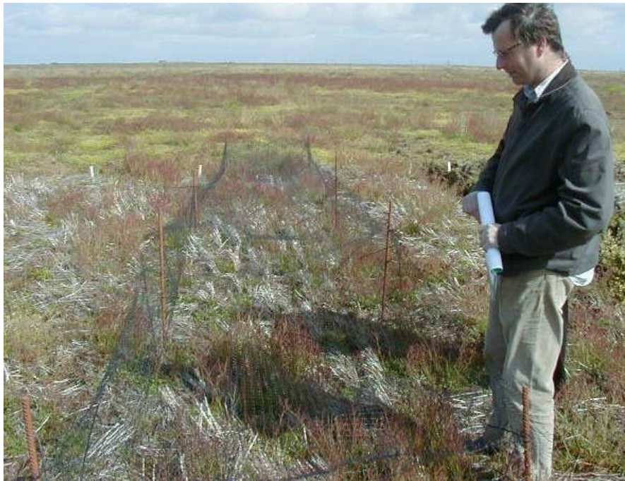
Mynd7 Sama og mynd 6.