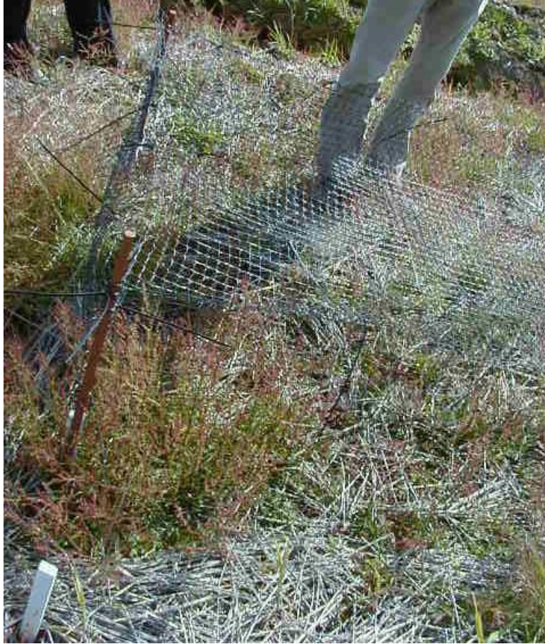
Mynd 6 Net var strengt yfir einn reitinn til að koma í veg fyrir að fuglar myndu hirða upp frá sem gætu verið eftir að byggið var skorið haustið 2003.