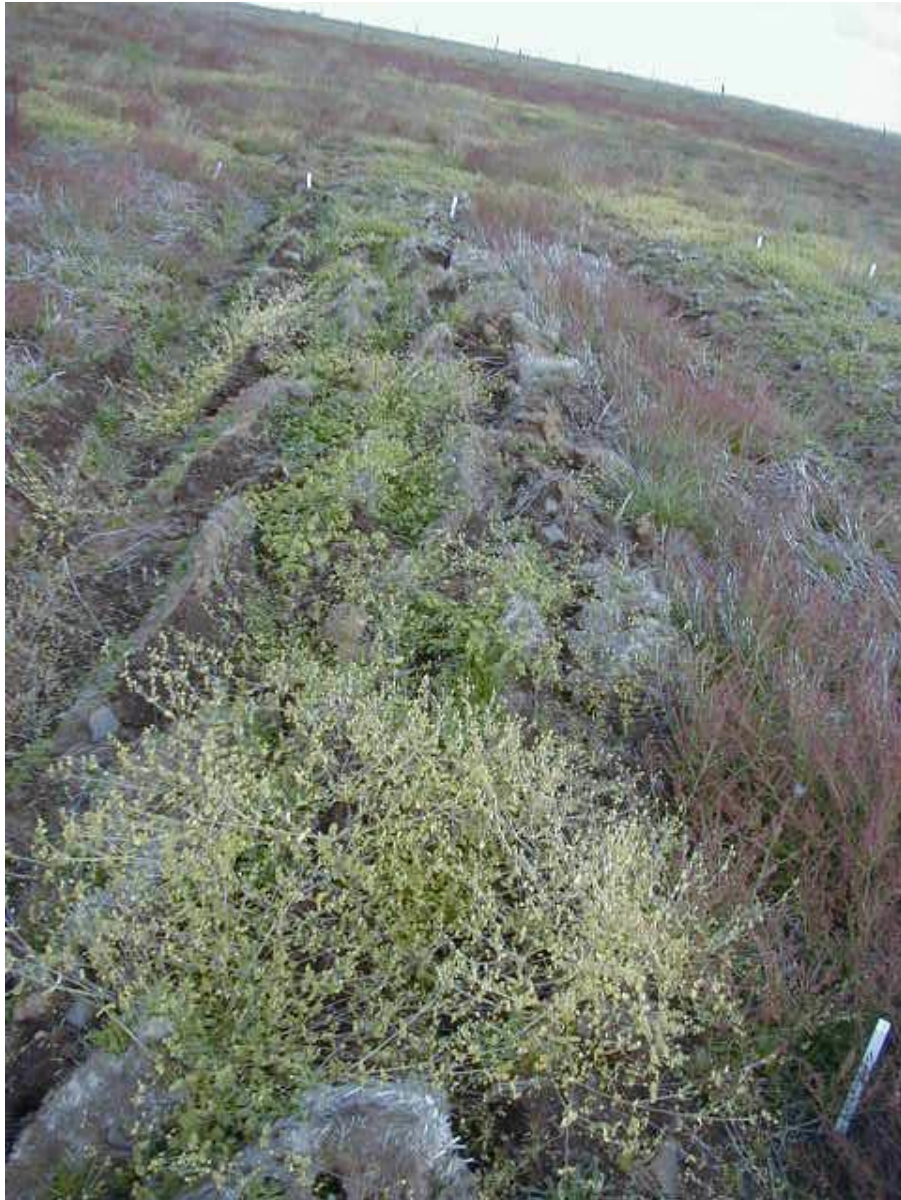
Mynd 8 Reitir sem erfðabreytt GP var ræktað í 2003, og var plægður um haustið.