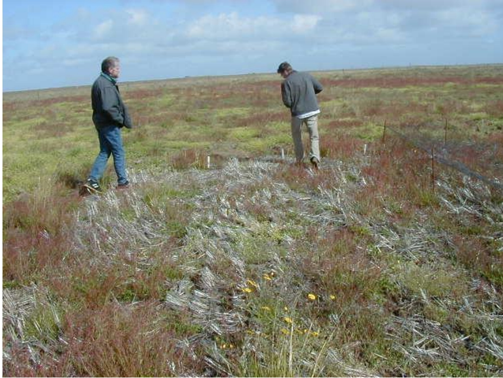
Mynd 4. Reitir sem erfðabreytt GP var ræktað í 2003, þessir reitir voru ekki plægðir.

Næstu myndir (4-8) sýna tilraunareitinn frá í fyrra (2003). Verið er að kanna hvort liðhlaupar vaxi. Eftir skurð voru flestir reitir látnir óhreyfðir, einn reitur var plægður að hausti(2003), einn reitur var plægður að hausti (2003) og vori (2004). Nokkir liðhlaupar voru sjáanlegir, en talið skv. fyrri reynslu er talið útilokað að þeir nái að mynda fræ, heldur komi byggplöntur (liðhlaupar) einungis upp fyrsta árið eftir ræktun.