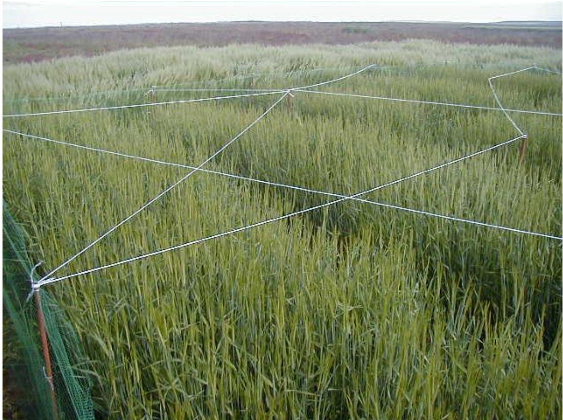
Mynd 11 Erfðabreytt Golden promise, 8 mism línur innan reitsins, línur strengdar yfir til að hindra gæsir.