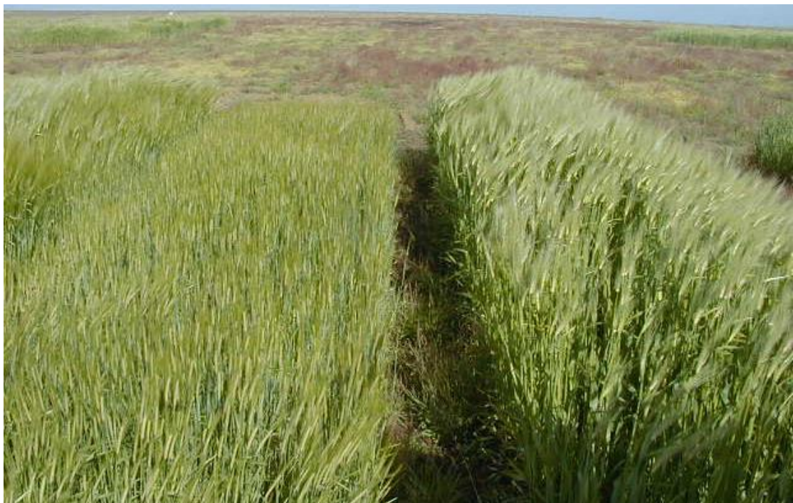
Mynd 3. Reitir með Ven, af fræjum tilraunareita frá 2003 þar sem Ven og Golden Promise og var plantað til skiptis, í endurteknum reitum hlið við hlið. Einnig fræjum af Ven sem var umhverfis erfðabreytta reitinn 2003. Leita á að blendingum. (upp kom spurning um hvað eigi að gera við plönturnar að því loknu)