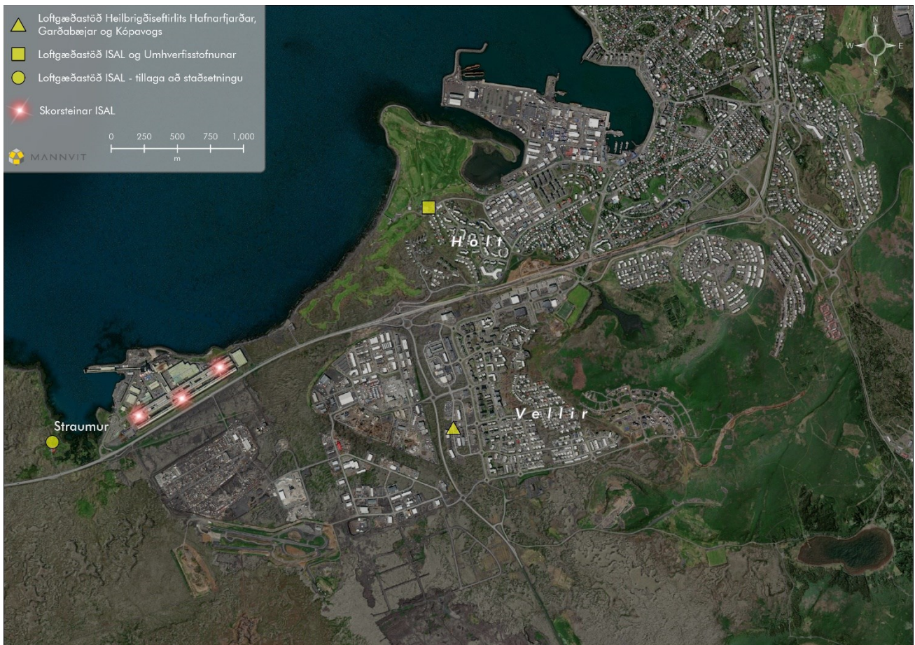
Mynd 1: Staðsetning loftgæðastöðva miðað við álverið í Straumsvík. Staðsetning vestan við ISAL er óviss.