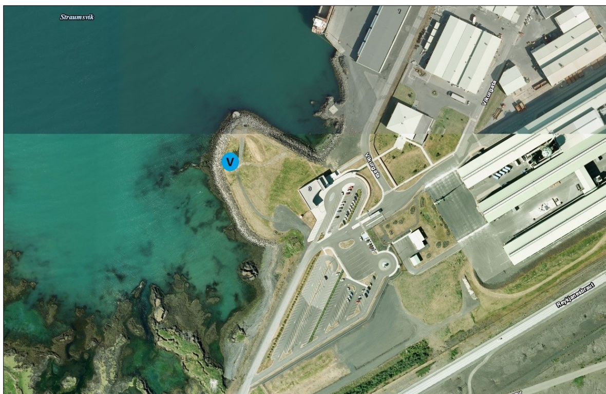
Mynd 2: Staðsetning veðurstöðvar er sýnd með bláum hring