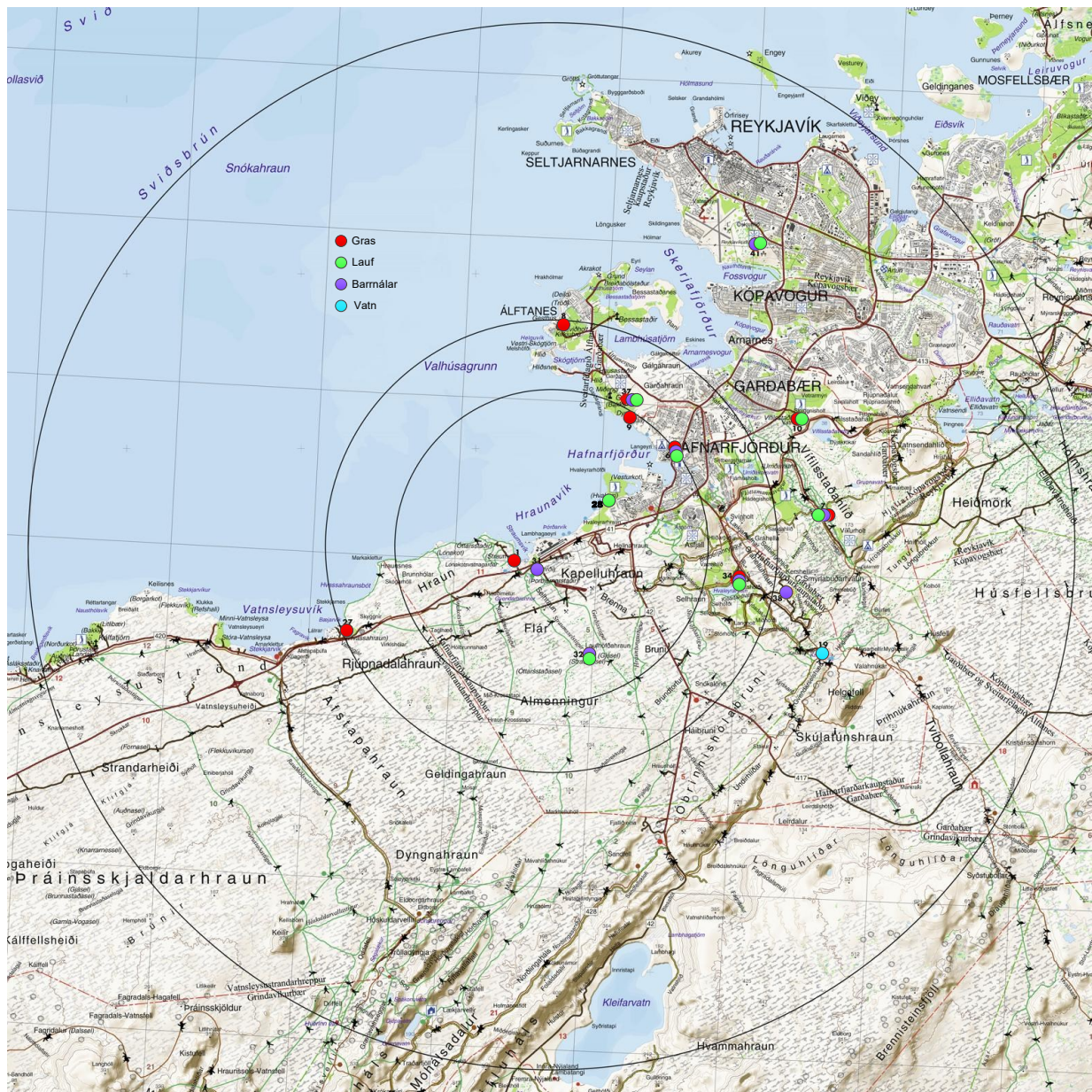
Mynd 3: Sýnatökustaðir gróðurs og vatns. Rauðir hringir eru sýnatökustaðir fyrir gras, grænir fyrir lauf, fjólubláir fyrir barnálar og blár hringur er sýnatökustaður fyrir vatn. Svartir hringir marka 4,5 og 6,5 km fjarlægð frá ISAL (sjá nánari skilgreiningu í gróðurskýrslu).